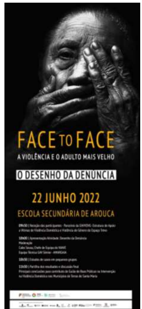
Figura 5: Cartaz do Seminário "Face to Face" - 22/06/2022

https://www.facebook.com/MunicipiodeArouca/posts/pfbid0keqAkSA8McnVUWe4qiNNTSCqo9y7KQ3b1Y5oaH9bLgoXqUiSbY1ttxZB87K7mSnI