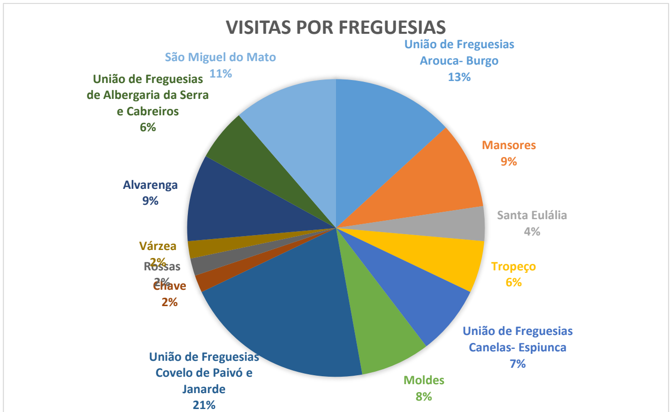
Gráfico 1: Visitas Extraordinárias já realizadas por Freguesias

Link: https://www.cm-arouca.pt/municipio/areas-de-atuacao/envelhecimento-ativo-e-saudavel/visitas-extraordinarias/