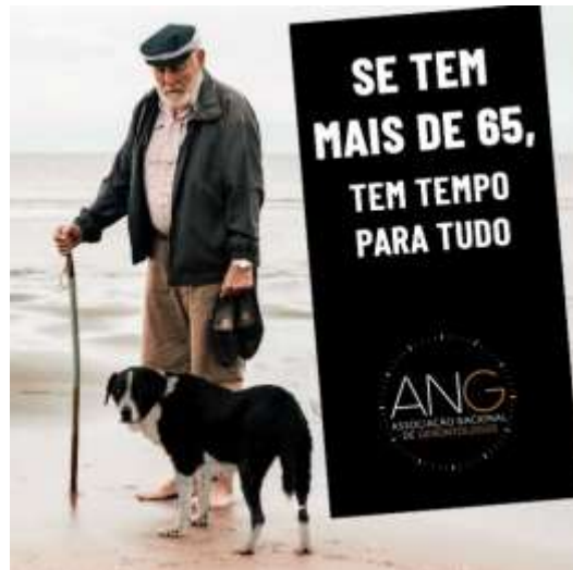
Figura 2: Imagem da campanha do Dia Internacional da Pessoa Idosa - 01/10/2022

3. Para assinalar o Dia da Consciencialização da Violência contra a Pessoa Idosa a 15 de junho de 2023, o Município de Arouca passou no painel de multimédia e afixaram-se cartazes com contactos úteis para as pessoas denunciarem qualquer tipo de violência.