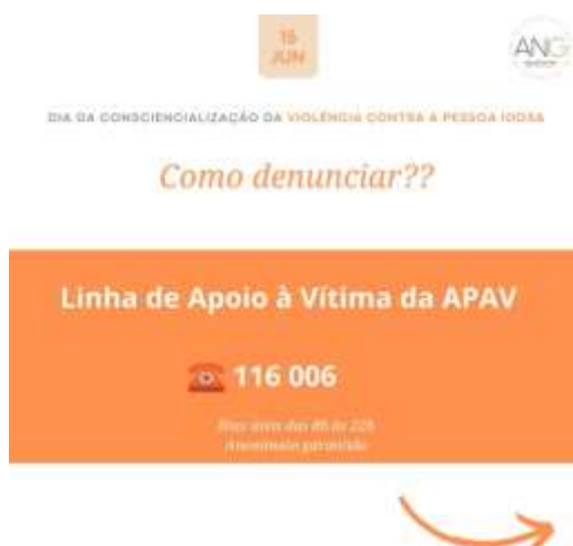
Figura 3: Imagem da campanha do Dia da Consciencialização da Violência contra a pessoa idosa - 15/06/2023

3. Para assinalar o Dia da Consciencialização da Violência contra a Pessoa Idosa a 15 de junho de 2023, o Município de Arouca passou no painel de multimédia e afixaram-se cartazes com contactos úteis para as pessoas denunciarem qualquer tipo de violência.