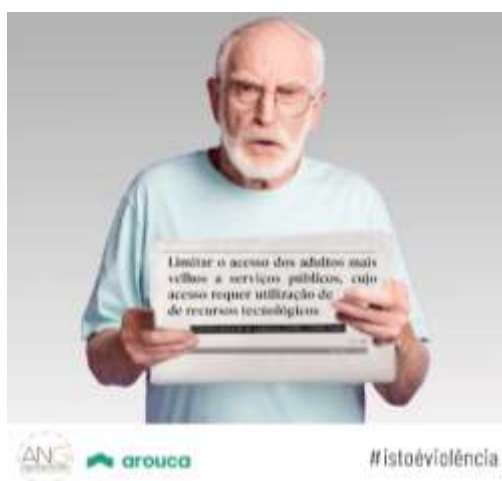
Figura 1: Imagem da campanha do Dia da Consciencialização da Violência contra a pessoa idosa - 15/05/2022

Link: Hoje, 15 de junho, é o Dia Mundial da... - Município de Arouca | Facebook