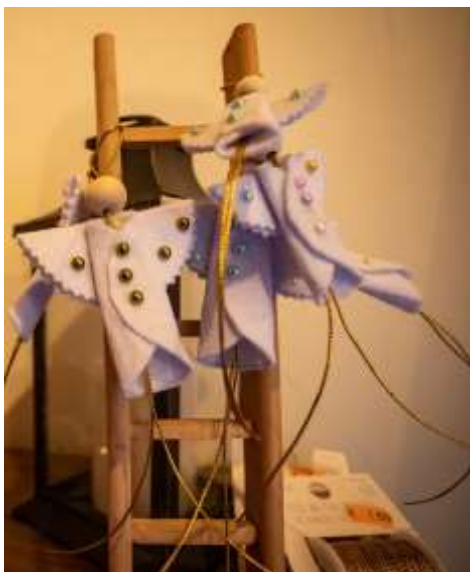
Figura 4: Oficina de Natal Intergeracional - 1/12/2024

Link: https://www.cm-arouca.pt/arouca-comemora-o-natal-com-atividades-para-toda-a-familia/ https://www.facebook.com/MunicipiodeArouca/posts/pfbid0QnUtWj9P5yu6CoGtDLpYxc68U48BFJbdSczVLxto5rDrvn1arhMRjLJoFjFnbamCl