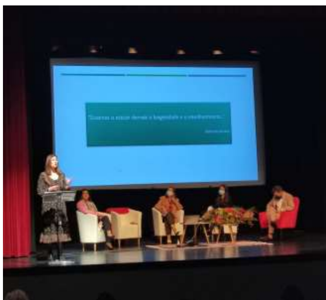
Figura 7: 1.º Encontro Municipal de Envelhecimento Saudável de Se Sever do Vouga