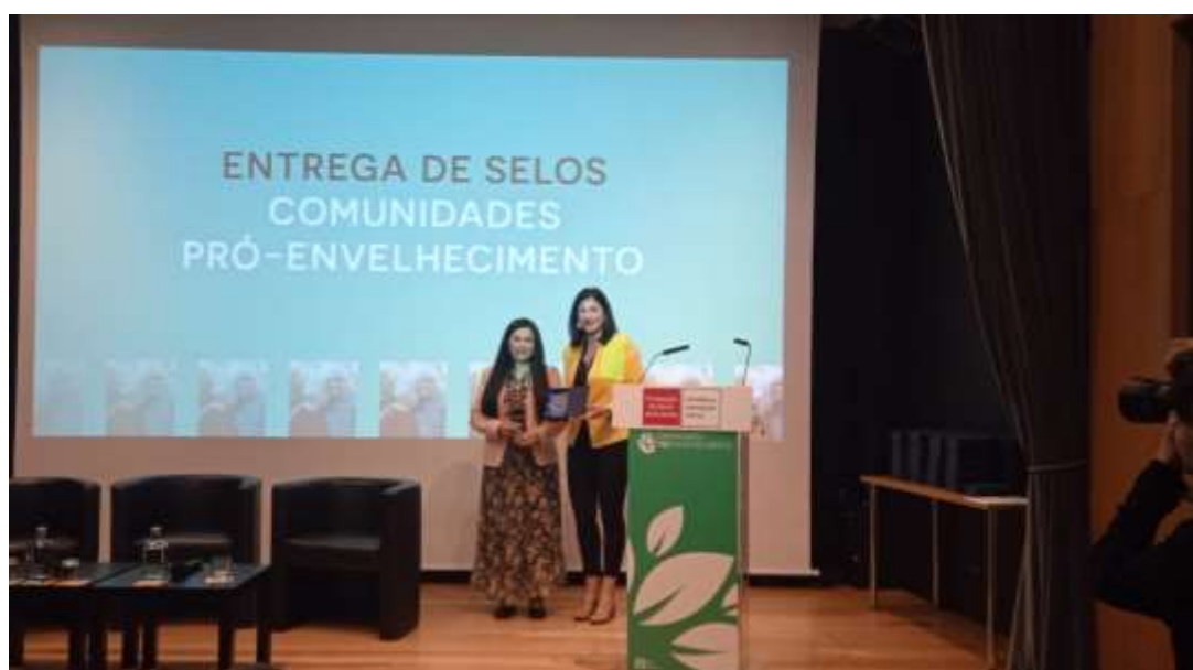
Figura 10: Cerimónia de entrega do Selo Comunidades Pró-Envelhecimento 2022-2024.

O trabalho desenvolvido no âmbito da promoção de um envelhecimento ativo e saudável foi reconhecido, tendo sido atribuído ao Município de Arouca, pela Ordem dos Psicólogos Portugueses o Selo Comunidades Pró-Envelhecimento 2022-2024. O objetivo dos Selos Comunidades Pró-Envelhecimento é reconhecer e distinguir as comunidades portuguesas cujas políticas, programas, planos estratégicos e práticas demonstrem um compromisso forte e efetivo com a promoção do envelhecimento saudável e bem-sucedido ao longo de todo o ciclo de vida.