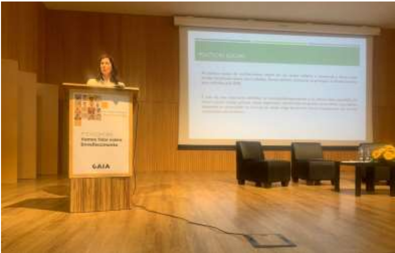
Figura 9: 1.º Encontro “Vamos falar sobre Envelhecimento - Vila Nova de Gaia