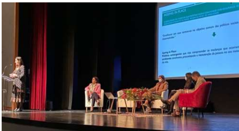
Figura 8: 1.º Encontro Municipal de Envelhecimento Saudável de Sever do Vouga – 01/04/2022